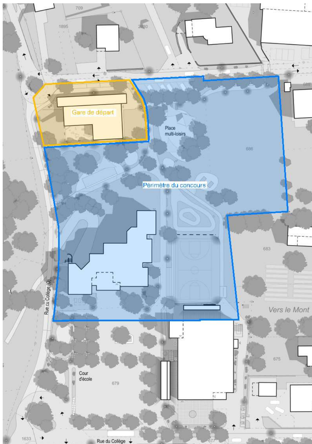
Périmètre d'intervention du concours